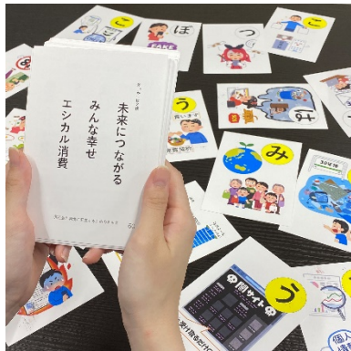
※写真は中高大学生向けのカルタです。